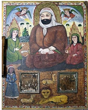
تصویر ۱۲: امام علی (ع) و حسن (ع) ، امامزاده هارون ولایت (ع) ، هارونیه، اصفهان

پیام عرفانی و الهی است؛ قدرت و رحمت، خشونت و مهربانی، قهر و لطف که همه در برابر انسان مقدس، رام و هماهنگ می‌باشند. در سنت نقاشی مذهبی قاجار، این ترکیب به معنای: نماد جامعیت شخصیت مقدس - هم شیر است و هم آهو را پناه می‌دهد - دارد؛