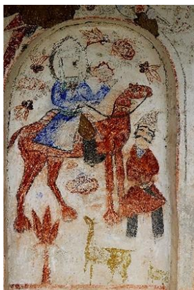
تصویر ۴: شفاعت (امام رضا (ع) )، آهوها نزد شکارچی، بقعه آقا سیدمحمد یمینی (ع) ، روستای گورابسر، آستانه اشرفیه، گیلان