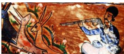
تصویر ۱۵: شکار آهو، سقانفار کرد کلا، جویبار، مازندران (Mahmoudi, 2011, P. 250)

در سقانفارهای مازندران، تصاویری از شکارچی سوار بر اسب، در حال شکار آهو مشاهده شده است. حرکات سر و دست شکارچی (با تفنگی در دست) همراه با حالت دم اسب، همگی به سمتی می‌باشد که تمام توجه و تمرکز را به آهو هدایت می‌کند (تصویر ۱۳ و ۱۵). تفنگی که این شکارچیان در دست دارند، از نوع تفنگ سر پُر است. قرارگیری نقش سگ در زیر پای اسب و حرکت به سمت آهو در صحنه، نشان‌دهنده محیط دشتی است که شکارچی در زمان شکار، همواره می‌توانست در آنجا حضور داشته باشد (تصویر ۱۴). بارها شکارچی صحنه شکار آهو را ملاحظه نموده، این صحنه توسط راویان به نقاش منتقل شده و نقاش