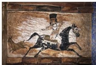
تصویر ۱۴: شکار آهو، سقانفار شرمه‌کلا، بابلسر، مازندران (Nourchi, 2013, P. 105)