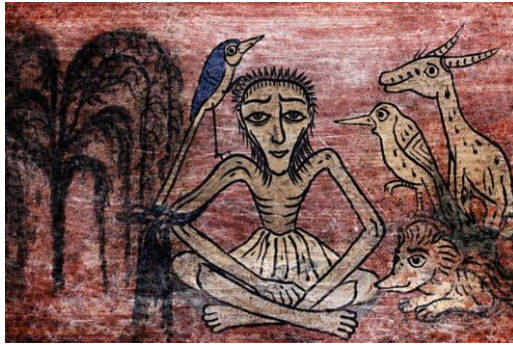
تصویر ۳: مجنون در بیابان، سقافار شرمه‌کلا، بابلسر، مازندران (MAHMOUDI, 2011, P. 212)