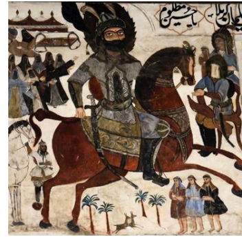
تصویر ۲: به میدان رفتن حضرت ابوالفضل (ع) ، بقعه و مسجد چهار پادشاهان (ع) ، لاهیجان، گیلان