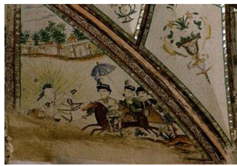
تصویر ۶: امام حسین (ع) و سلطان قیس هندی، امامزاده سلطان‌علی (ع) ، روستای مشهد ارده‌ال، کاشان، اصفهان

انجامیده است. این شیوه ترسیم با دیواره‌نگاری بومی مازندران-خطوط ساده، رنگ‌های تخت و حالات اغراق‌شده- همسویی کامل دارد. این صحنه، یک تمثیل بصری است که با مفاهیمی چون ستم و مظلومیت، خطر و حفاظت الهی و همچنین با چرخه حیات پیوند می‌خورد. آهو در دیوارنگاره‌ها معمولاً در جایگاه «مظلوم» ظاهر می‌شود. پلنگ در فرهنگ مازندران نماد شجاعت، قدرت و حفاظت از سرزمین است و اغلب در افسانه‌ها و نقش‌مایه‌های هنری به‌عنوان نگهبان طبیعت و حامی مردم تصویر می‌شود. حضور این موجود در نقاشی‌ها و دیوارنگاره‌ها، نشان‌دهنده احترام به حیوانات قهرمان و نماد اقتدار محلی می‌باشد (تصویر ۱۰). نقش‌مایه شیر در بنای سقانفار چمارکتی، شیری نر را نمایش می‌دهد که با دهانی باز و زبانی بیرون‌زده، در حال تعقیب آهو است. چنین صحنه‌ای، بیشتر جنبه آیین، قدرت و عدالت را نشان می‌دهد. شیر با بدنی کشیده، با یال‌هایی موج‌دار و با دست جلویی بلند، در حال فرود آمدن بر پیکر آهو است. آهو نیز، با بدنی ظریف، گردنی بلند و حالتی متمایل به عقب، در موقعیت دفاعی ناامیدانه قرار دارد؛ در اینجا، شیر، پادشاه درنده‌خو و نیرومند طبیعت و آهو، ضعیف و بی‌پناه است. این تقابل می‌تواند نماینده چرخه طبیعت باشد؛ طبیعت بی‌رحم و قدرتمند در برابر موجود ضعیف. در این خوانش، تصویر یک تمثیل از سرنوشت انسان می‌باشد؛ طبیعت یا تقدیر، همیشه قوی‌تر از انسان است. قدرت می‌تواند «بی‌رحم» شود؛ پس، انسان باید به پناهگاه معنوی (سقانفار) متوسل شود. بنابراین، جهان پر از نیروهای قاهر و