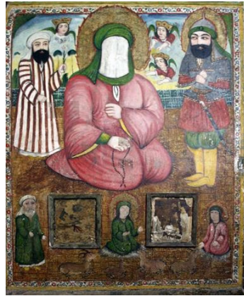
تصویر ۵: تمثال پیامبر (ص)، امام‌زاده هارون ولایت (ع) ، هارونیه، اصفهان