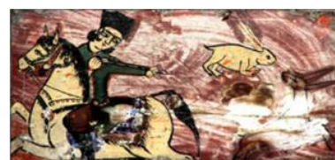
تصویر ۱۳: شکار آهو، سقانفار کرد کلا، جویبار، مازندران (Mahmoudi, 2011, P. 250)