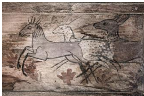
تصویر ۱: سقافار هندوکلا، آمل، مازندران (Nourchi, 2013, P. 136)

گاهی در برخی مجالس در محدوده‌های بیابانی، آهوهای در جست‌وگریز دیده می‌شوند که وجودشان بیشتر به‌خاطر