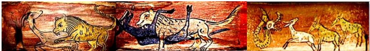
تصویر ۱۱: نبرد شیر و آهو، سقانفار چمازکئی، بابل، مازندران (Mahmoudi, 2011, P. 246)

ناگهانی است؛ انسان بی‌پناه برای حفظ روح و جان خود نیازمند توسل، نذر و حمایت معنوی می‌باشد. مضمون شیر و آهو از پرتکرارترین مضمون‌ها در دیوان شمس هستند. از این‌رو، مولوی در معنی استغراق، چنین تمثیلی را به‌کار می‌برد: «شیری در پی آهوپی کرد. از وی می‌گریخت. دو هستی بود: یکی هستی شیر و دیگری هستی آهو، اما چون شیر به او رسید، در زیر پنجه او قهر شد و از هیبت شیر، بیهوش و از خود بی‌خود شد، در پیش شیر افتاد، این ساعت هستی شیر ماند، تا تنها هستی آهو محو شد و نماند؛