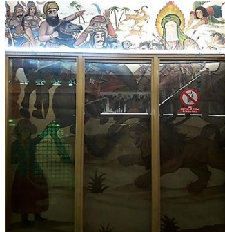
تصویر ۷: امام حسین (ع) و سلطان قیس هندی، امامزاده شاه‌زید (ع) ، اصفهان