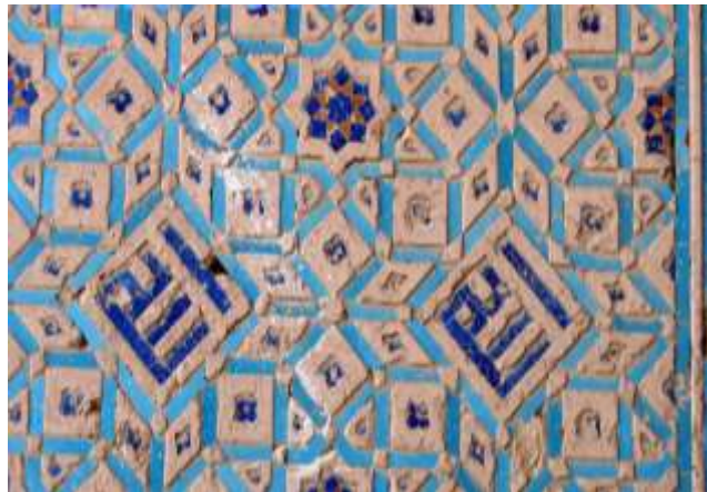
تصویر ۱۱: تزیینات آجر و کاشی‌کاری، مدرسه غیاثیه خرگرد، دوره تیموری، خواف