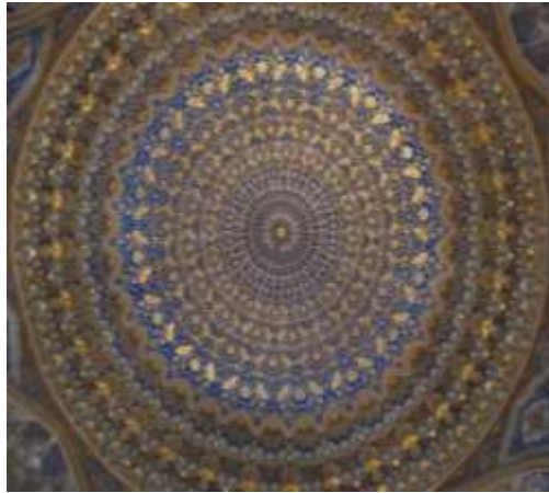
تصویر ۱۲: تزیینات داخلی گور امیر، اواخر قرن ۱۴م، سمرقند