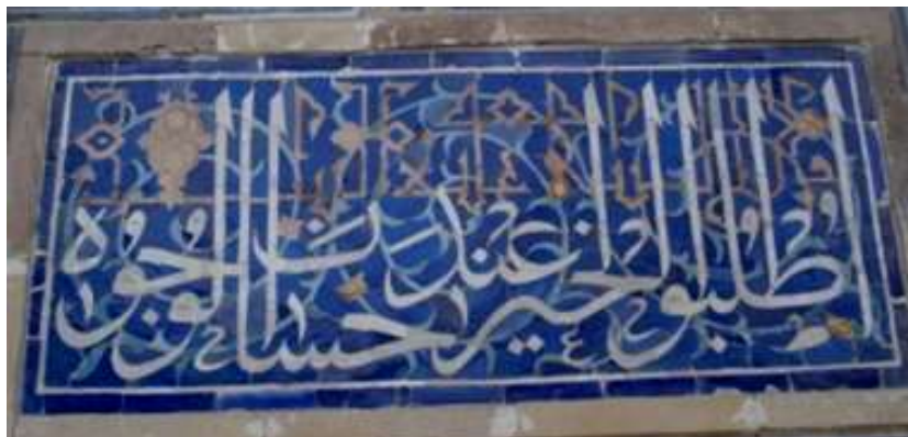
تصویر ۵: کتیبه خط ثلث و کوفی با تکنیک کاشی‌کاری معرق، مدرسه الغیبیک، سمرقند، ازبکستان

معماری مورد استفاده قرار گرفت. خط و کتیبه‌های خطی در معماری غالباً در بردارنده آیات کتاب خدا و یا سخن بزرگان است که روح خاصی را در بنا به جریان می‌افکند و جلوه عبادی و قدسی ویژه‌ای را به بنا می‌دهد. در این باره پوپ