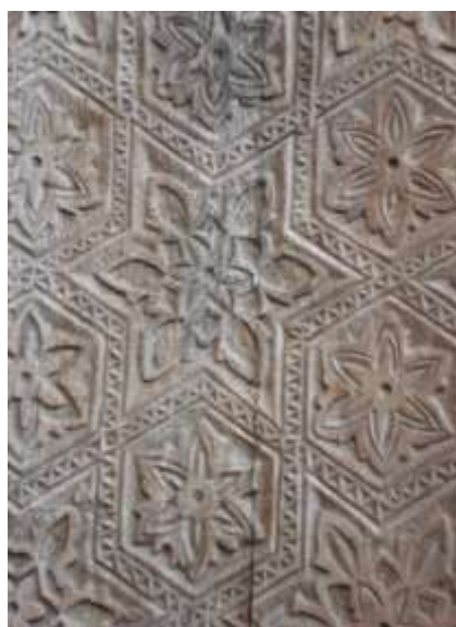
تصویر ۱۰: نقوش هندسی و ختایی در تزیین چوب، دوره تیموری، سمرقند