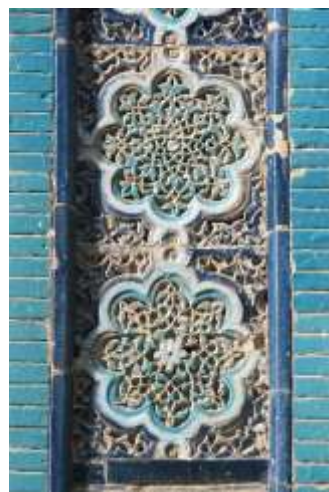
تصویر ۸: بخشی از تزئینات کاشی‌کاری مجموعه مقابر شاه‌زنده، دوره تیموری، سمرقند