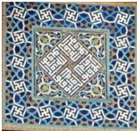
تصویر ۴: نقش هندسی شمسه و پیلی در هنر کاشی‌کاری مسجد جامع گوهرشاد، دوره تیموری

گسترده‌ای برای تزئین آثار هنری از جمله معماری استفاده کرده‌اند (Mosadeghian, 2005). در دوره سلجوقیان، هنرمندان ایرانی فرم‌های هندسی را با مهارت خاصی به نهایت پیچیدگی و تکامل رساندند و در دوره تیموری اصول و طرح معماری، ارتباط بسیار نزدیکی با تزئینات هندسی پیدا کرد. این نقوش هندسی پیچیده که «گره» نامیده می‌شود، شبکه‌ای از انواع نقوش هندسی هستند که فضاهای مثبت و منفی در آن‌ها ارزشی برابر دارند. این گره‌ها بر اصول و قواعدی بنا نهاده شده‌اند که ترسیم کلی آن بر مبنای دایره و واگیره‌ای به نام «ام‌الگره» است که بنا بر تقسیمات و زوایای خطوط نقش‌های متنوع و مشخصی را ایجاد می‌کند که در تکرار باعث ایجاد نقوش هندسی می‌شوند. مقرنس یکی از عناصری که در تزئین بناهای دوره تیموری استفاده شده و از سطوح برآمده و فرورفته تشکیل شده است. غیاث‌الدین جمشید کاشانی ریاضیدان و منجم این دوره، مقرنس‌ها را از نظر شکل و ترسیم هندسی به چهار نوع تقسیم می‌کند: ۱. مقرنس ساده. ۲. مقرنس مطین (گلین). ۳. مقرنس القوس (کمائی). ۴. مقرنس شیرازی که بسیار پیچیده‌تر از انواع دیگر است. مقرنس به‌عنوان عنصری تزئینی