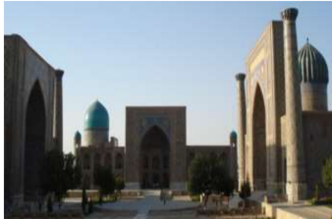
تصویر ۲: مجموعه بناهای میدان ریگستان، سمرقند، دوره تیموری