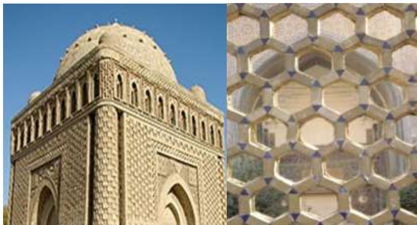
تصویر ۶: مقبره امیر اسماعیل سامانی، اوایل دوران اسلامی، (قرن ۱۰م)، بخارا، ازبکستان

آنکه، چون دوران گذشته، نمای تزئینی آجری همراه با چیده شدن دیوارهای اصلی بنا شده است. دوم آنکه، بعد از سفت‌کاری و ساخته‌شدن اسکلت بنا با «آجرگری» یک پوشش تزئینی از آجر به‌صورت پوسته خارجی بر بنا افزوده‌اند؛