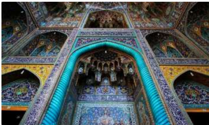
تصویر ۹: شاهکار هنر کاشی‌کاری، مسجد گوهرشاد، دوره تیموری