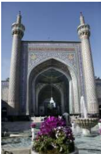
تصویر ۱: مسجد جامع گوهرشاد

اسلامی ایران روشن می‌سازد (Burkhart, 2011, p. 134).