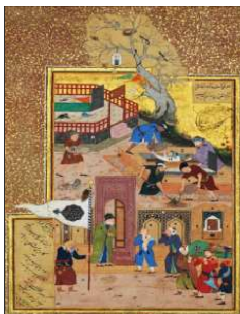
تصویر ۱: گریه پسر بر مرگ پدر، منطق الطیر عطار، برگ، f.35r، ۸۸۴ ق. هرات، نگارگر بهزاد، کاتب سلطانعلی مشهدی، موزه متروپولیتن