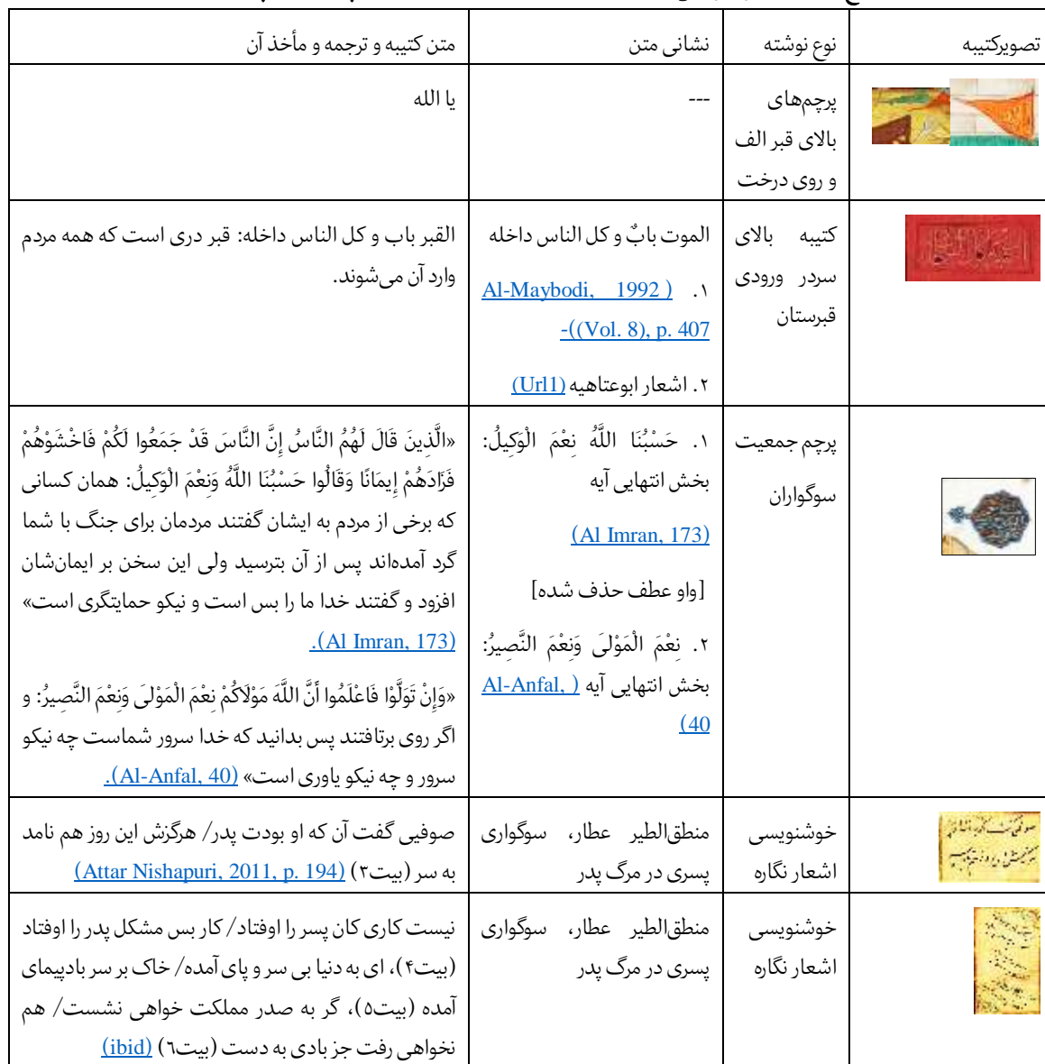
جدول ۵: تشریح کتیبه‌های خوشنویسی وابسته به بنا و غیروابسته به بنا در نگاره گریه پسر بر مرگ پدر (مأخذ: نگارندگان)